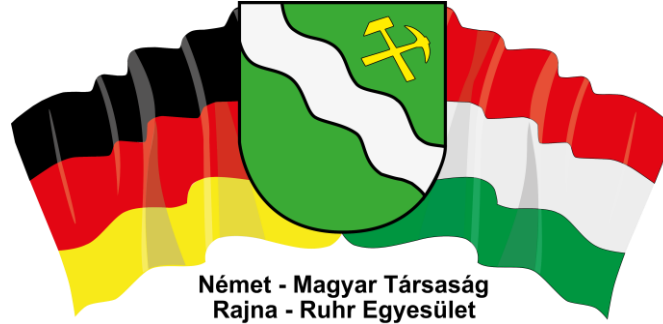
Német - Magyar Társaság Rajna - Ruhr Egyesület